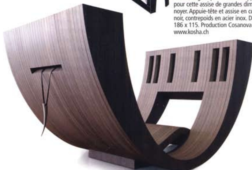
KOSHA. Lignes pures et enveloppantes pour cette assise de grandes dimensions en noyer. Appuie-tête et assise en cuir blanc ou noir, contrepoids en acier inox. Dimensions: 186 x 115. Production Cosanova 2010. www.kosha.ch