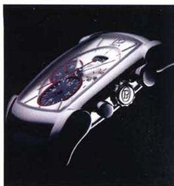
Parmigiani Design d'un chronographe reprenant les codes de la marque tout en apportant du caractère et une esthétique sportive.