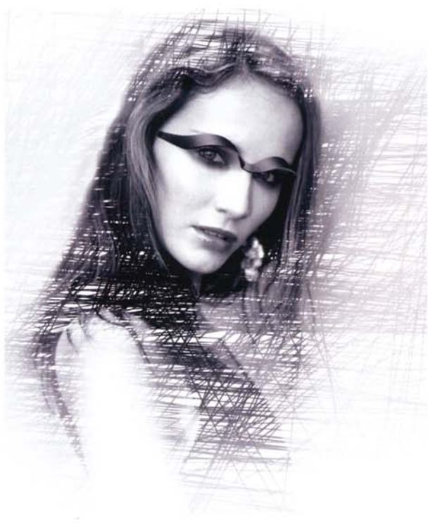
Plume – visière solaire. 1 er prix concours lunetiers du Jura.