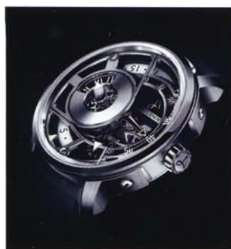
Hautlence Le design de cette montre exceptionnelle est inspiré de l'esthétique brute de pièces mécaniques usinées.